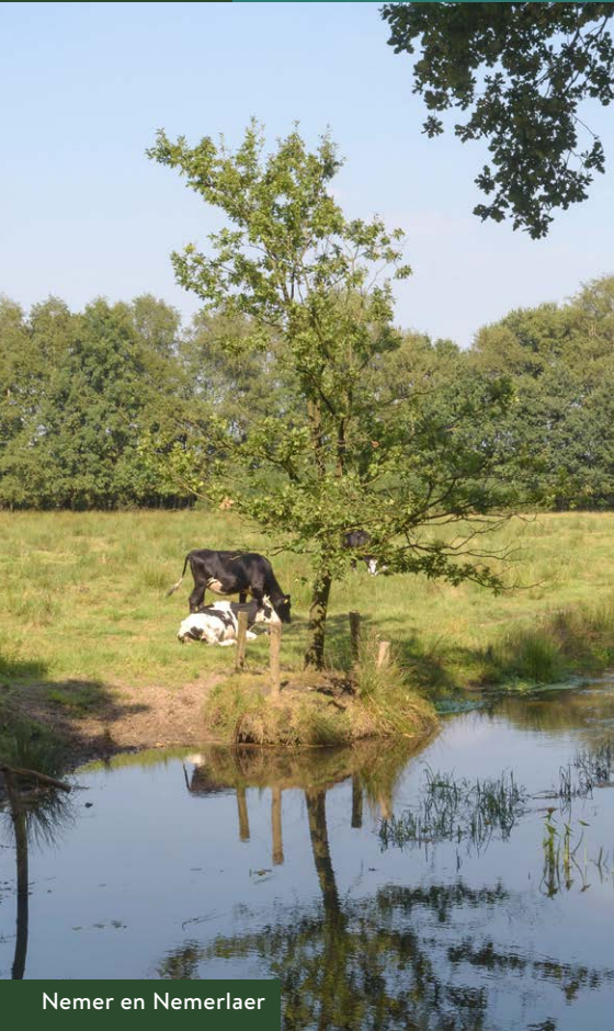
Nemer en Nemerlaer